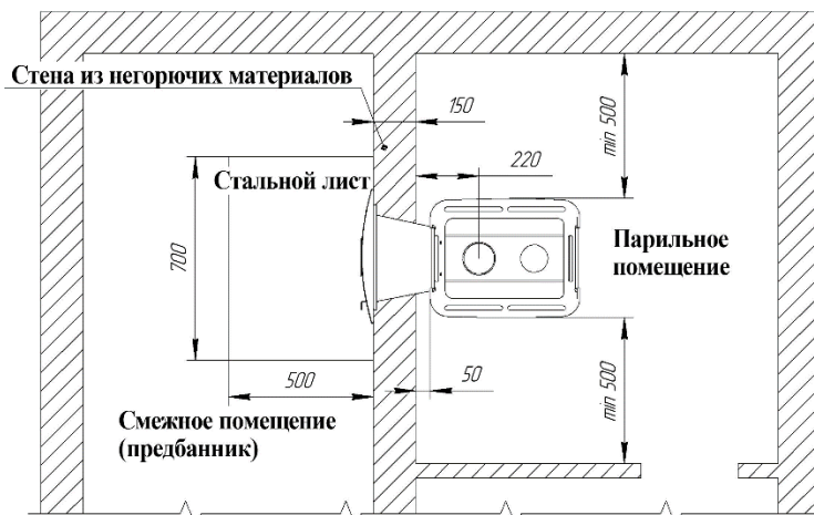
Рисунок 2. Схема установки печи. Вид сверху